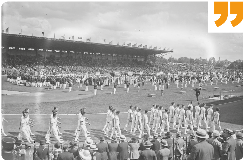
Cérémonie d'ouverture des Jeux d'été de Paris de 1924, stade de Colombes.